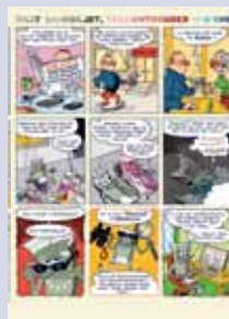
'Billy Bankbiljet' Cartoon over Toezicht