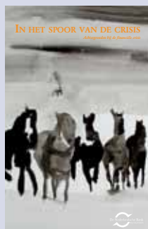
Achtergronden bij de financiële crisis