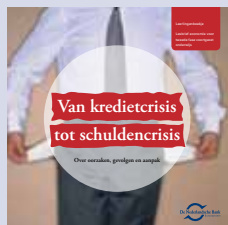
Lesbrief tweede fase havo/vwo