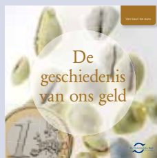
'De geschiedenis van ons geld'