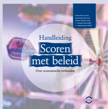
'Scoren met beleid' digitaal lesprogramma tweede fase havo/vwo

Onder meer de volgende uitgaven van de Nederlandsche Bank zijn verkrijgbaar: