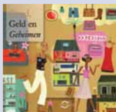
'Goud, Geld en Geheimen' publieksbrochure